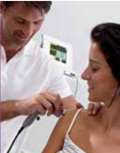
Gymna 400 series